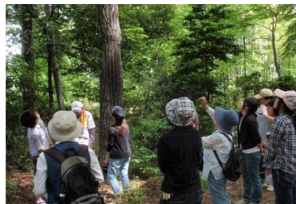
独歩の森での植物観察