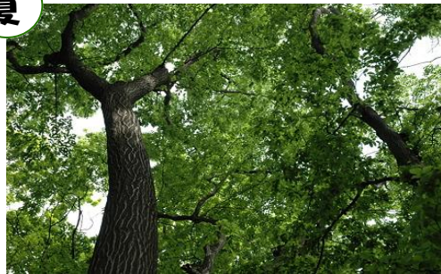
うっそうと茂る樹木