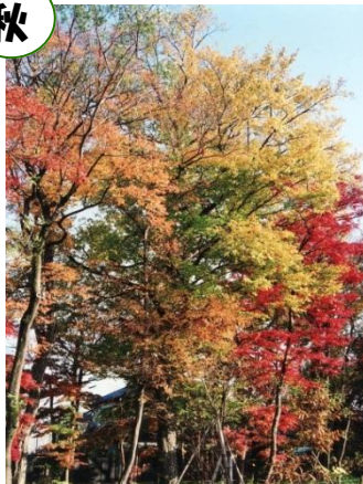
イロハモミジの紅葉と イヌシデの黄葉