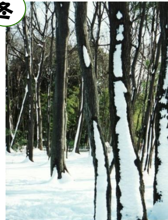
清楚に雪化粧の 「独歩の森」