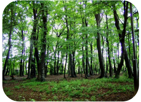
境山野緑地の南側雑木林「独歩の森」

コナラやクヌギといったドングリの木を中心とする武蔵野本来の雑木林は、今では武蔵野市内からほとんど姿を消し、「独歩の森」が唯一のものとなりました。武蔵野市の歴史と文化が感じられる貴重な自然空間です。