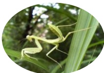
ハラビロカマキリ