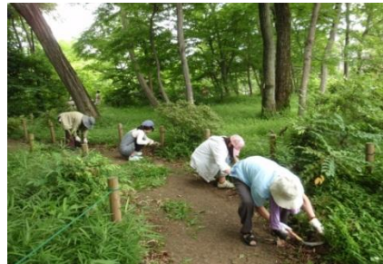
園路にはみ出た草の除去