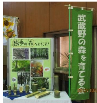
西部コミセン文化祭での展示

武蔵野プレイスで開催された「むさしの教育フォーラム」で、市民性を高める教育の事例として、第二小学校が「独歩の森」での授業を発表しました。当会が協力している活動も紹介されました。