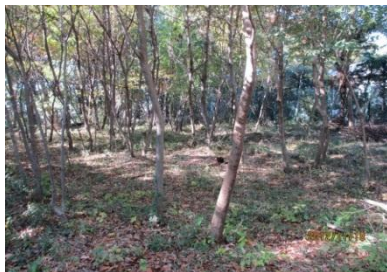
福生市「文化の森」の再生した雑木林

ボランティアセンター武蔵野（VCM）主催のボランティアフェスタに参加し、模造紙展示や参加団体の交流会でネットワークを広げました。