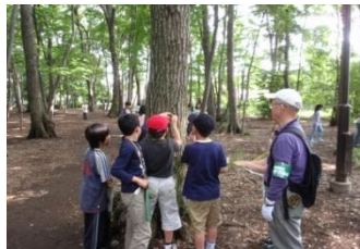
第二小学校の授業に協力