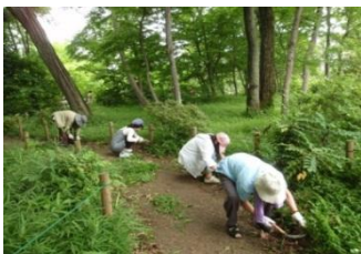
園路にはみ出た草の除去

このような活動に、あなたもぜひ参加し、一緒にいい汗を流しませんか？詳しいことは、Eメールで当会までお問い合わせください。