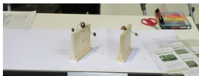
どんぐり人形の 完成見本

私たちの展示を含め、今回の環境フェスタが市民の方々のエコライフに役立つ事と期待しています。